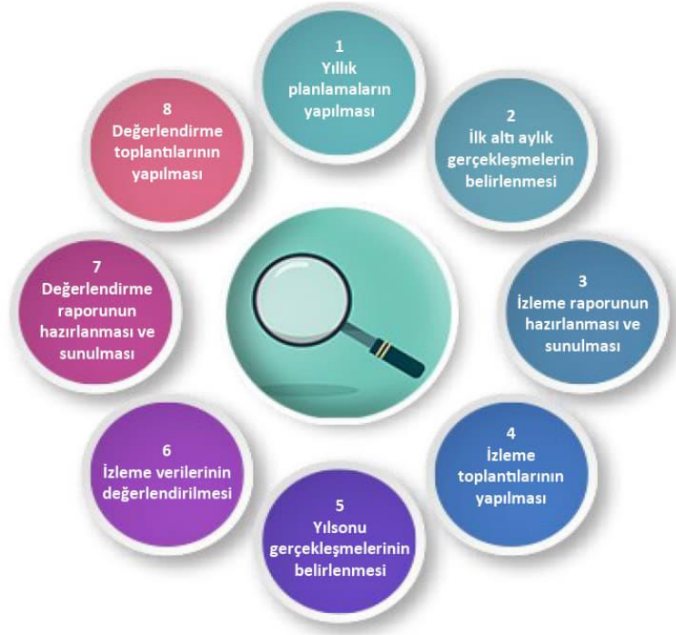
Şekil-4 İzleme ve Değerlendirme Süreci

İzleme ve değerlendirme sürecinin işleyişi ana hatları ile yukarıdaki şekilde özetlenmiştir. Okulumuz Stratejik Planı izleme ve değerlendirme çalışmalarında 5 yıllık Stratejik Planın izlenmesi ve 1 yıllık gelişim planının izlenmesi olarak ikili bir ayrıma gidilecektir. Stratejik planın izlenmesinde 6 aylık dönemlerde izleme yapılacak denetim birimleri, il ve ilçe millî eğitim müdürlüğü ve Bakanlık denetim ve sorumluların denetime hazırlık olarak izleme evraklarının hazırlanması sağlanacak.